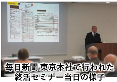
毎日新聞 東京本社で行われた 終活セミナー当日の様子